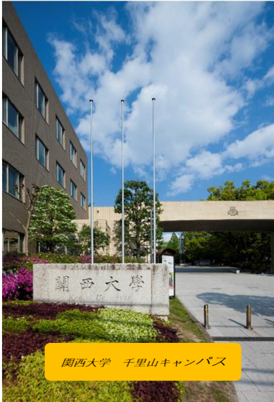
関西大学 千里山キャンパス